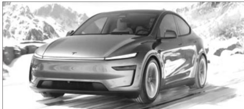
Tesla Model Y Juniper, a Model Y frissített változata

Ha külön típusokra lebontva nézzük az eredményeket, mégis örülhet a Tesla, Németországban is, mivel a legkelendőbb elektromos modell tavaly is a Tesla Model Y volt, amiből közel 30 ezer talált gazdára, viszont ez is 16 ezres lemaradást jelent az egy évvel korábbi eredményhez képest. A második helyet a Skoda Enyaq szerezte meg, amiből több mint 25 ezret helyeztek forgalomba, ami enyhe növekedés 2023-hoz képest, 1764 darabbal érekesítettek többet a modelltől, mint egy évvel koráb-