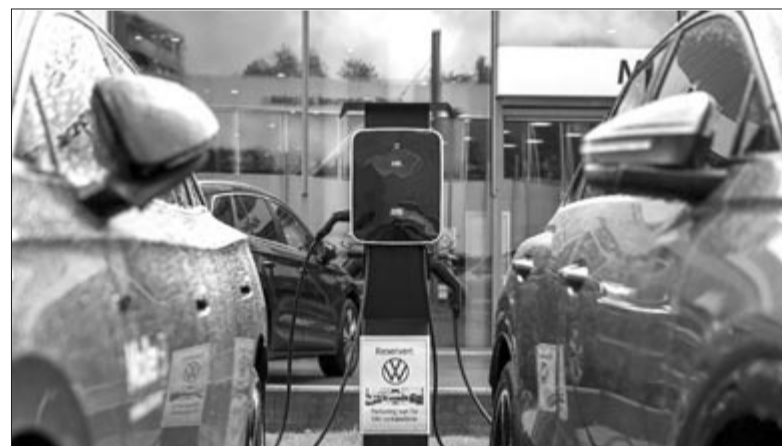
Tízből kilenc új autó elektromos volt Norvégiában 2024-ben, illusztráció