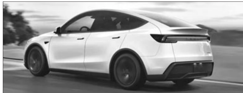
Tesla Model Y Juniper, a Model Y frissített változata hátulról