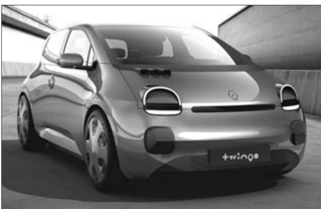
Renault Twingo E-Tech Concept