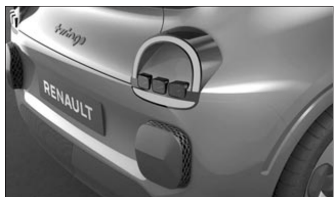
Renault Twingo E-Tech Concept-féklámpa

A beltér kaotikus és színes, ez az első két szó, ami eszünkbe jutott a képekről, viszont ebben is hasonlít az első Twingóra, tehát beleillik a márka retrofuturisztikus irányvonalába. Helyet kapott a betérben egy 10,1 hüvelykes központi kijelző és egy 7 hüvelykes digitális műszeregység. Továbbá ki kell emelni azt a jópofa részletet, hogy a klimatekerők mellé helyezték a vészvillogó – szándékosan – túlméretezett gombját, bár az igazi az lett volna, ha a kijelző tetejére tudják felszerelni, de így is érthető az utalás az első Twingóra. Ahogy a kárpit színes mintázata is az első generáció emléke előtt tiszteleg.