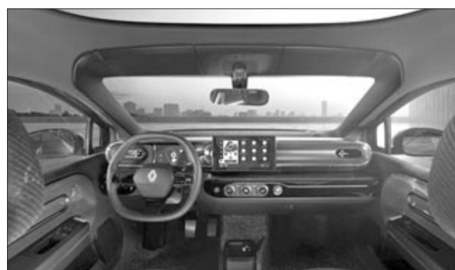
Renault Twingo E-Tech Concept-beltér

A Twingo E-Tech Electric koncepcióban elvileg több olyan elem is van, amit majd a későbbi modellekben is vizionálhatunk. A Renault ígérete szerint az Ampr Small platformra kifejlesztett autót 2026-ban fogják piacra dobni. A gyártó ezzel a típussal szeretne egy újabb fejezetet nyitni a Twingo 30 éves történetében. A Renault egy korábbi közleményében arról tett említést, hogy a Twingo elektromos változatának indulására 20 ezer euró alatt lesz.