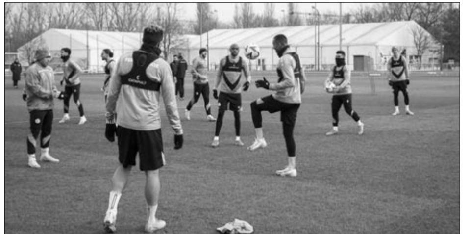
A Ferencváros edzése a labdarúgó Európa-liga nyolcaddöntőbe jutásért kiírt, Viktoria Plzen elleni mérkőzés előtt az FTC-MVM Sportközpontban, február 12-én.

A PAOK – FCSB találkozót ma 22 órai kezdettel rendezik, a DigiSport 1 és a Prima Sport 1 televízió élőben közvetíti.