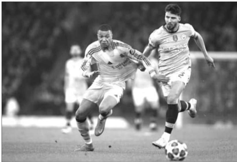
Rúben Dias, a Manchester City (jobb) és Kylian Mbappé, a Real Madrid játékosa a Manchester City – Real Madrid mérkőzésen a manchesteri Etihad Stadionban 2025. február 11-én.

Bajnokok Ligája, a nyolcaddöntőbe jutásért, 1. mérkőzések: Manchester City – Real Madrid 2-3, Juventus – PSV Eindhoven 2-1, Sporting Lisszabon – Borussia Dortmund 0-3, Brest – Paris Saint-Germain 0-3.