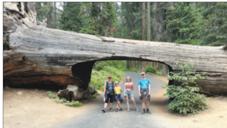
A Tunnel Log – 5,2 m széles és 2,4 m magas alagút egy útra dőlt mamutfenyőben

tábormokkal (General Sherman Tree). Az amerikai polgárháború parancnokáról elnevezett fa, bár nem is a legmagasabb és nem is a legszelebb, törzstér fogata szerint a legnagyobb a világon. A 2000 esztendőnél idősebb fa törzsének átmérője alul 11, kerülete 31, magassága 84 méter, térfogata 1487 köbméter. Összehasonlításképpen képzeljük magunk elé Erdély legmagasabb templomtornyát, a kolozsvári Szent Mihály-templom masszív, mennybetörő alkotmányát, amely kereszttestül 80 méteres. Sok más gigásszal is megismerkedhettünk közelebbről. Különösen jó érzés volt megérinteni a fák vörösesbarna, barázdás kérget, és tudni azt, hogy Krisztussal egyidős életeteket simogathatunk. Eljutottunk az egyik útra dőlt fa élettelen törzséhez is, amelybe egy 5,2 méter széles és 2,4 méter magas alagutat vájtak. Miután átsétáltunk a Tunnel Lognak nevezett mamutfenyő alagút alatt, visszatértünk az autónkhoz, és nyugat felé gurultunk le a hegyekből.