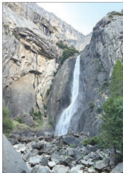
A 739 m-es Yosemite vizesés legsalsó lépcsője

Az azonban látnunk csodás dolgokat is. Az Óriás-erdőben sétálva „találkozhattunk” a park egyik legnevezetesebb fájával, a Sherman