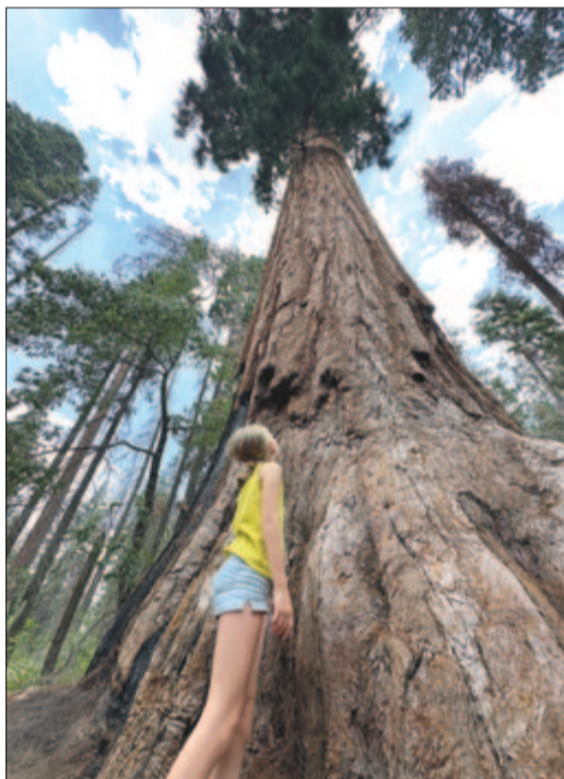
Törpe az óriások közt. Mamutfenyő a Sequoia Nemzeti Parkban

Las Vegasból a Halál-völgyet is magába foglaló Mojave-sivatagon keresztül, fásasztó, forró, 600 kilométeres utazás után érkezünk meg a kaliforniai Bakersfieldbe. A mezőgazdaságról és kőolaj-kitermeléséről ismert város számunkra csak tranzitállomás volt Kalifornia elsőrangú nemzeti parkjai felé.