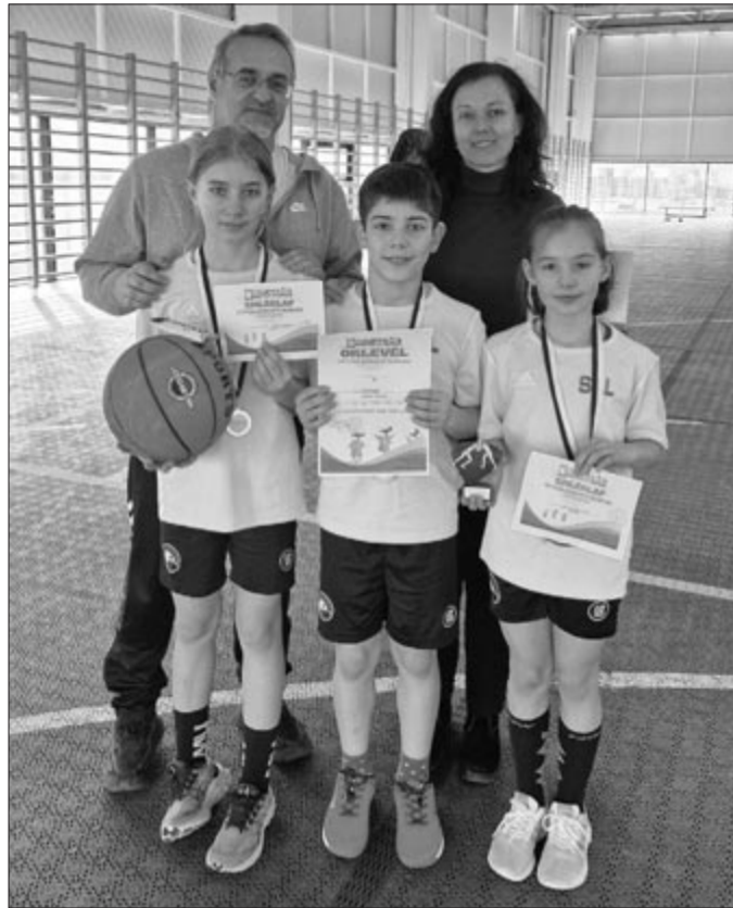
A szovátai S. Illyés Lajos iskola csapata hozta a legjobb eredményt az erdőszentgyörgyi körzeti szakaszon

A nyárádszeredai körzeti szakaszon ugyancsak hat csapat mérte össze erejét, ügyességét és kitartását: a nyárádmagyarósi Ügyeskek és a jobbágytelki Virgoncok mellett a nyárádszeredai Deák Farkas Általános Iskola négy csapattal jelentkezett: az ATM, a Hüllők, a Gepárdok és a Godzillák is igyekezett jó eredményt elérni. A jó hangulatú és izgalmas megmérettetésen minden csapat nagyszerű teljesítményt nyújtott, és bebizonyította, hogy a sport nemcsak verseny, hanem öröm, csapatmunka és kitartás is.