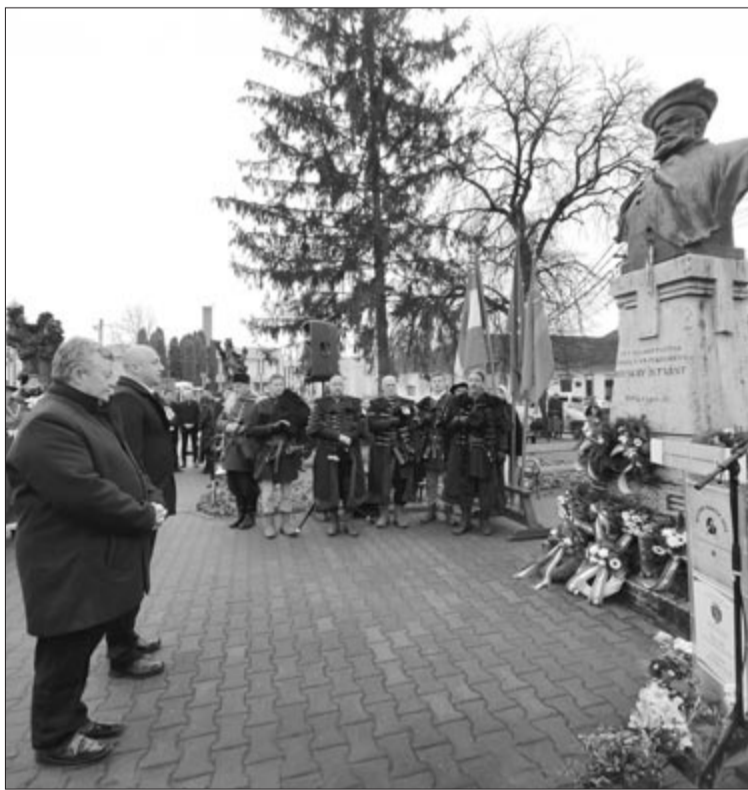
Harmincketedik alkalommal hajtanak fejet a fejedelem szobra előtt

A Bocskai Napokat Nyárádszereda Polgármesteri Hivatala és a Bekecs Táncszínház szervezi, a Vándormozi filmünnep támogatója a Nemzeti Filmintézet, partnerei az NFI Archívum, az FP Films és a Taylor Projects Kft. A szervezésből a helyi egyházak, a sportklub, a középiskola, a városi könyvtár, a Nyárádvölgyi Kistérségi Társulás, a Nyárádvölgyi Bocskai Mézlovagrend is kivette a részét.