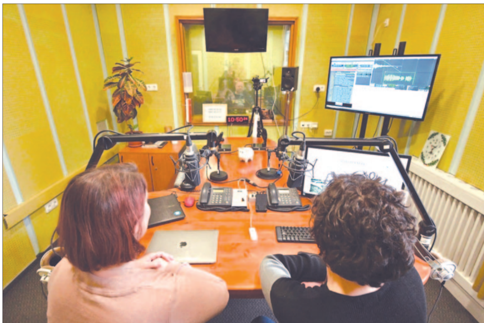
Élőben a hallgatókkal