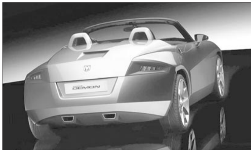
Dodge Demon koncepcióautó. A Dodge a 2000-es évek második felében mutatta be ezt az egyedi koncepciót, amely soha nem került sorozatgyártásba