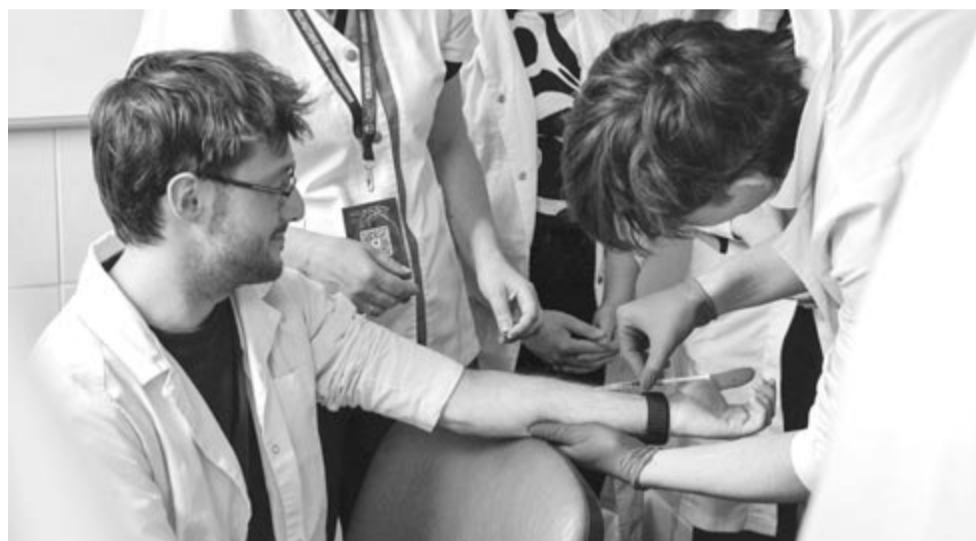
Betekintés a műhelymunkákba