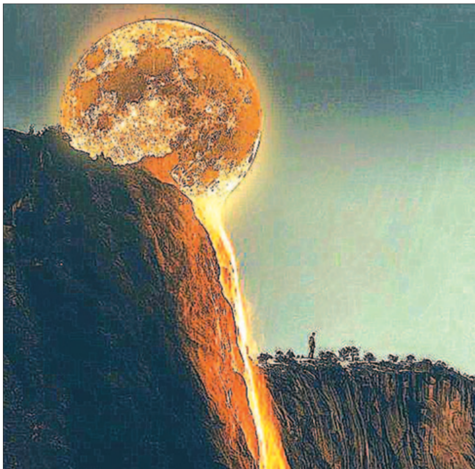
A Hold fényzuhataga előtt egy ember-parány

Kelt 2025-ben, május 16-án, Mózes és Bontond napján