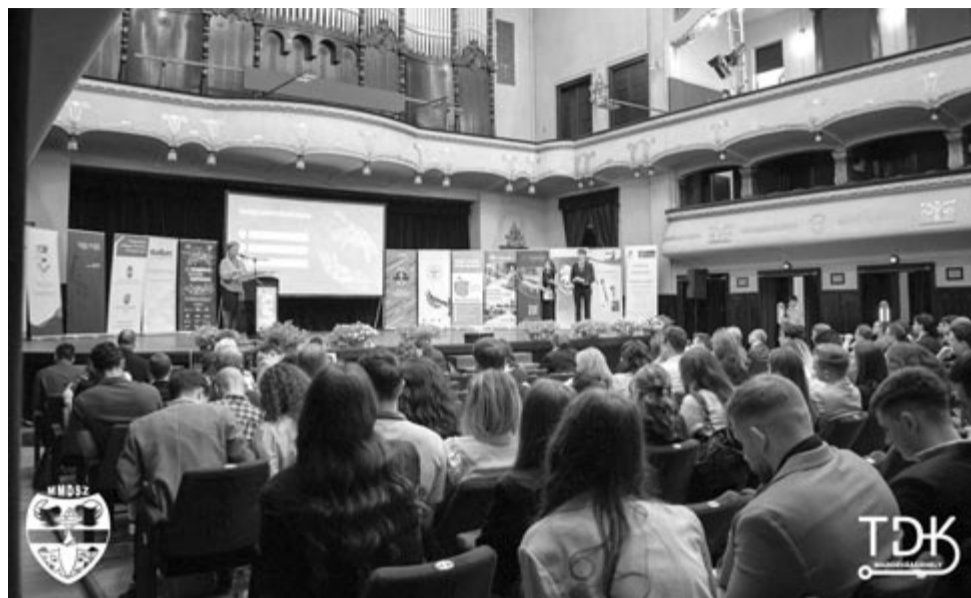
Telt házas előadás a TDK-n