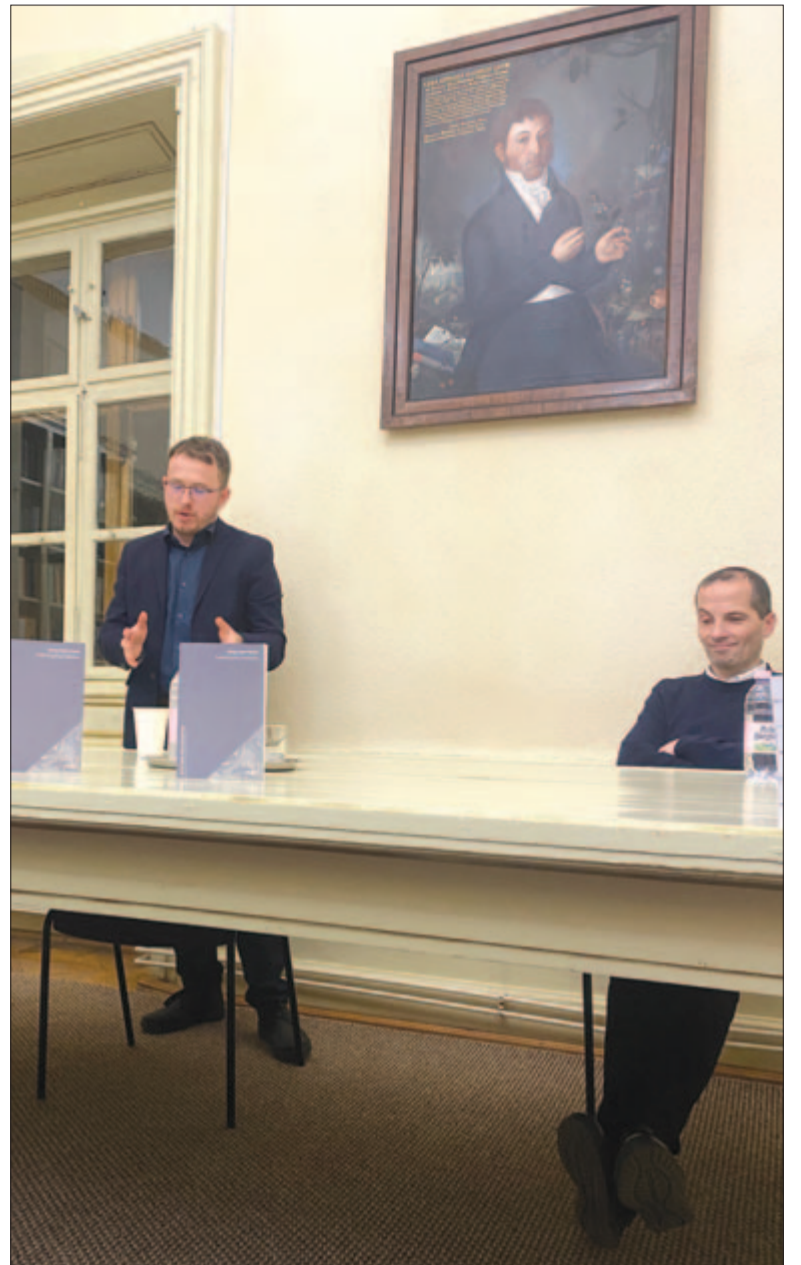
A könyv bemutatóján