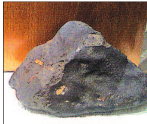
Körülragyognak másvilági képek – A mócsi meteorit egy darabja az ELTE geológiai múzeumban

„Ott totyog majd az öreg tanár, te pedig –” „...melletted megyek, mert az öreg tanárné felett is éppen úgy eljár az idő,” és elindulnak, mert semmi közük még az időhöz, csak a szerelem izzik fel bennük pillanatokra úgy, hogy azt hiszik: életük minden zugába bevilágít. A szerelem épp olyan lámpa, mint minden lámpa. A fénykörén kívül totyognak később a férfiak megöregedve, s a leejtett bot után hajolva ütközik kezük