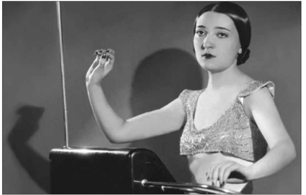
Clara Rockmore – tereminen és Thereminel egyaránt jól játszott

A professzor amolyan elektronikus félisten szerepét vitte színre az Újvilágban. Korának technikai lehetőségeit elképesztő módon kihasználva olyan technikai találmányokkal rukkolt elő, hogy azok láttán még ma is elcsodálkoznánk. Ott volt például a terpsiton, ami érzékelte a színpadon táncolók mozgását,