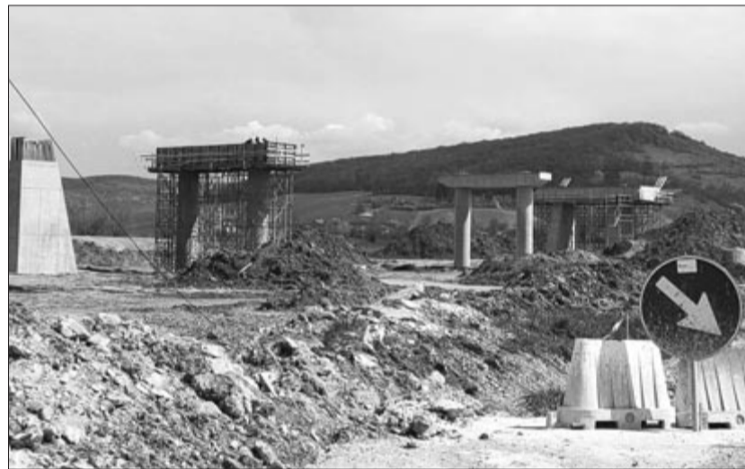
A kivitelezés folyik az első szakaszon, de a másodikon még nincs pénz a munkálatfelügyeletre sem

A közbeszerzési eljárás egyik feltétele kimondja, hogy a szerződést csak akkor kötik meg a nyertes szolgáltatóval, ha sikerül rá az országos költségvetésből vagy vissza nem térítendő európai forrásokból pénzalapot szerezni vagy jóváhagyni. Az elektronikus közbeszerzési rendszerben (SEAP) szereplő hirdetés szerint a CNAIR az idei első fél évben szerezne meg a szerződés finanszírozásához szükséges pénzalapot.