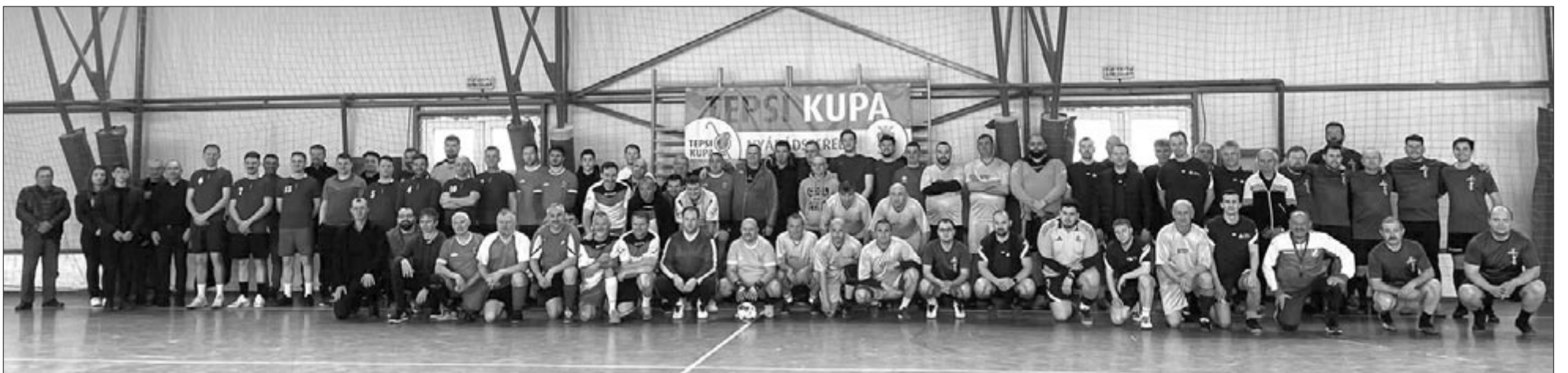
Mintegy nyolcvan lelkész vett részt az idei teremfoci- és asztalitenisz vetélkedőkön