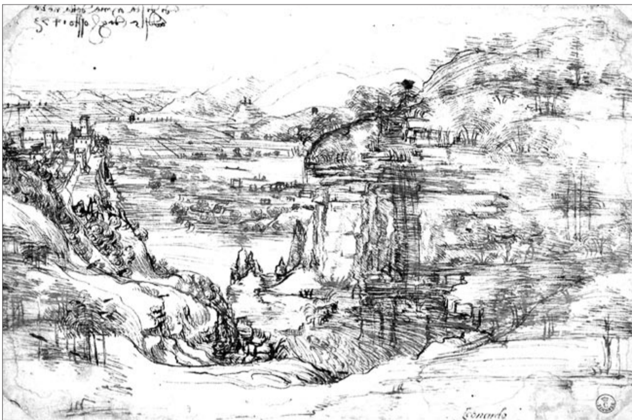
574 éve, 1452. április 15-én született Leonardo da Vinci itáliai polihisztor. Az Arno folyó völgyét ábrázoló, itt látható grafikáját, melynek eredetije az Uffizi Képtárban található, 1473-ban készítette.