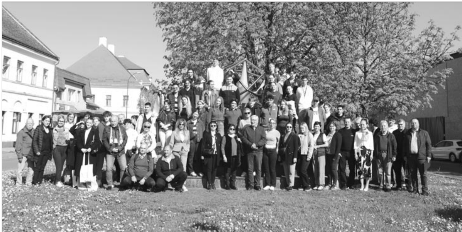
A találkozó résztvevői a Pszeudoszféránál

Az ünnepélyes együttlét a vándorbot átadásával zárult. A továbbiakban a salgótarjáni Bolyai János Gimnázium viszi tovább ezt a fontos úti támaszt, a jövő tanévben pedig ez a tanintézmény látja vendégül a Kárpát-medence Bolyai iskoláinak küldöttségét.