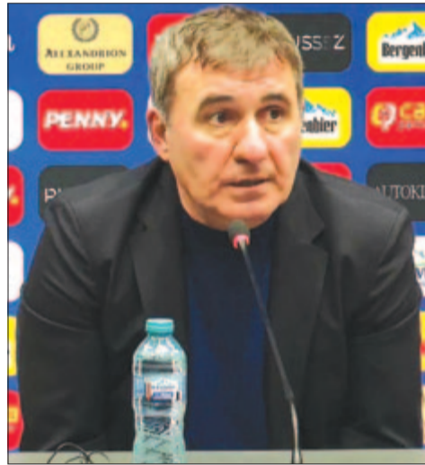
A labdarúgó-szövetség tegnapi sajtótájékoztatóján

Hagi korábban – 2001-ben, szeptembertől novemberig – már vezette a nemzeti együttest, négy mérkőzésen irányítva azt: vb-selejtezőn 2-0-ra legyőzték Magyarországot és 1-1-re játszottak Grúziával, majd a vb-pótselejtezőben 2-1-re kikaptak Szlovéniától Ljubljanában, és 1-1-re játszottak velük Bukarestben.