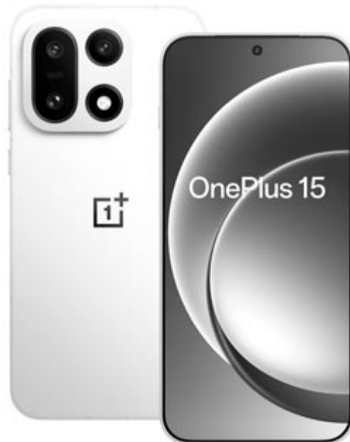
OnePlus 15, illusztráció

Fontos megjegyezni, hogy a OnePlus Magyarországon (és minden bizonnyal Romániában is) nem hagyja magára a felhasználóit! Továbbra is minden ígért szolgáltatást (szoftverfrissítések, garancia) biztosít az eredeti feltételek szerinti ideig.