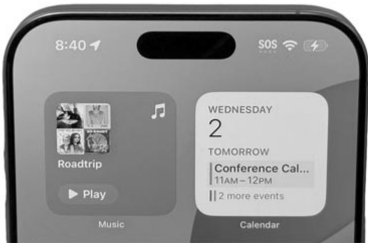
Dynamics Island, illusztráció

Fontos kiemelni, hogy ez egyelőre csak egy híresztelés, hogy valóban így lesz-e, az leghamarabb fél év múlva kiderül ki. Viszont egyre biztosabbnak tűnik, hogy az Apple nagy késéssel az ősszel végre bemutatja az első, hajlítható kijelzővel szerelt iPhone-t, az iPhone Foldot, ami miatt borulhat a vállalat évek óta megszokott menetrendje. A híresztelések arról szólnak, hogy az iPhone 18 Pro és Pro Max mutatkozhat be 2026 szeptemberében az iPhone Fold mellett, a széria olcsóbb tagja vagy tagjai, illetve az iPhone Air 2 csak valamikor 2027 tavaszán. Azt is érdemes hozzátenni, hogy minden bizonnyal az Apple 2027 őszére is készül valamivel az iPhone tekintetében, hiszen másfél év múlva fogja ünnepelni a telefon fennállásának 20. születésnapját. Ha visszagondolunk 2017-re és az iPhone X-re, ami akkor egyértelműen forradalmi számított, joggal feltételezhetjük, hogy az újabb jubileum alkalmával is lesz valamilyen nagyobb újítás, de az egyelőre kérdés, hogy ez mi lesz.