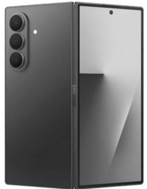
Samsung Galaxy Z Fold7, a jelenlegi hajlítható csúcs-Samsung, illusztráció

Ahogy az imént is beszámoltunk róla, minden jel arra mutat, hogy idén ősszel végre megérkezik az Apple első hajlítható okostelefonja, amelynek a kijelzőjét a Samsung fogja szállítani, és amely a legtöbb feltételezés szerint jobb lesz, mint a dél-koreai gyártó saját eszközei, vagyis a Fold-szériáé. Így joggal merült fel a kérdés, hogy miért ad a Samsung jobb kijelzőket