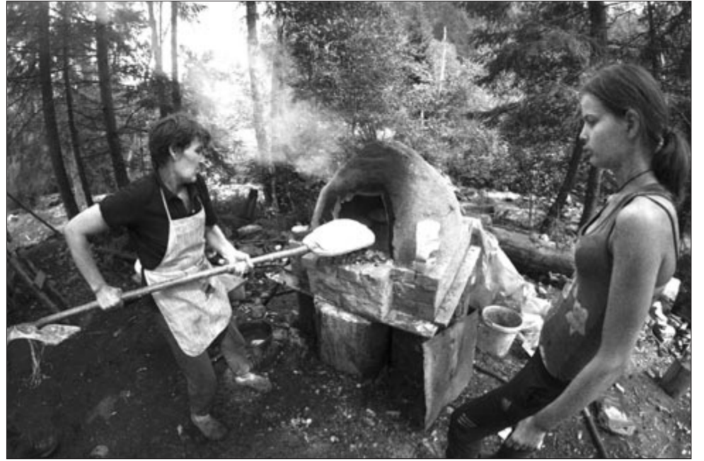
A család is élte a tüzet

deniük, gondjaikról, elégtételeikről, magányukról, családi, társas létükről, szerves beilleszkedésükről a természetbe, mindarról, amiért mindezt felvállalják. Ezek felmutatására nem elégséges egyetlen fotózás, sem tíz, sem félszáz alkalom. Ehhez hosszabb ideig ott kell lenni a szénégetőknél, elnyerni bizalmukat, barátságukat, hallgatni történeteiket, együtt örülni, búslakodni velük, látni, ahogy őrzik, ügyelik, hogy tűzzel, fojtással baj ne legyen, ahogy gazdálkodnak, főleg, ha a család is asszonyostul, gyerekestül velük megy a szénégető szezonzra, észlelni a mesterségbeli tudnivalókat, beidegződések átörökítését és így tovább. A fotós ezt tette. Jobban mondván a fotósok, a Marx József Fotóklub tagjai, akik gyakran együtt járnak, és ugyanazokat a jelenségeket, nagyjából ugyanazokat a szemé-