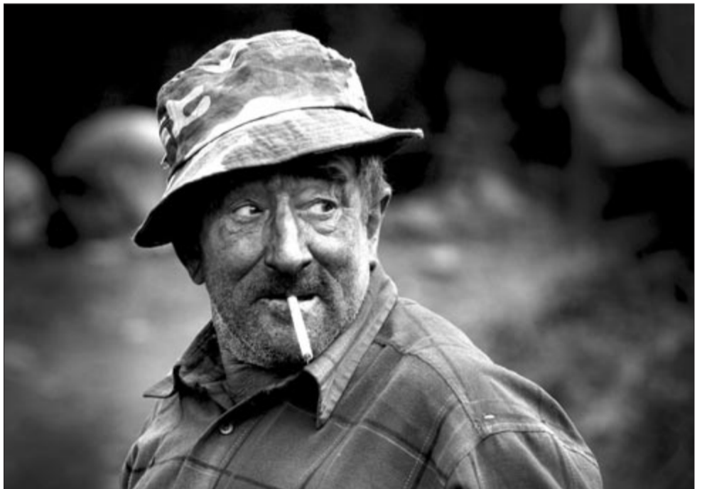
Mindenre figyelni kell!