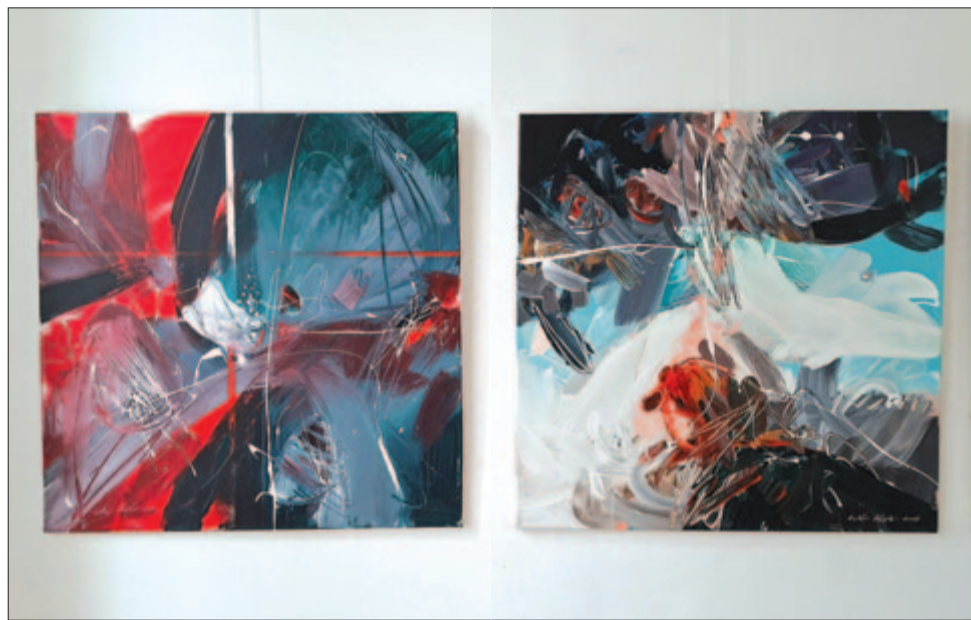
Botár László képei

nem az elismerés utáni vágyból születnek, hanem az alkotás örömeiből, abból a szabadságból, amely csak az önvizsgálatból fakadhat. Együtt mutatják meg, hogy az