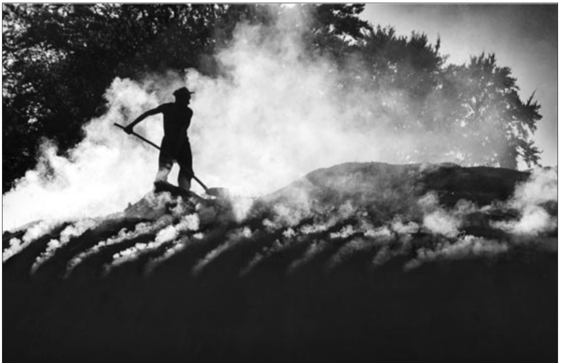
A boksa izzó pokla