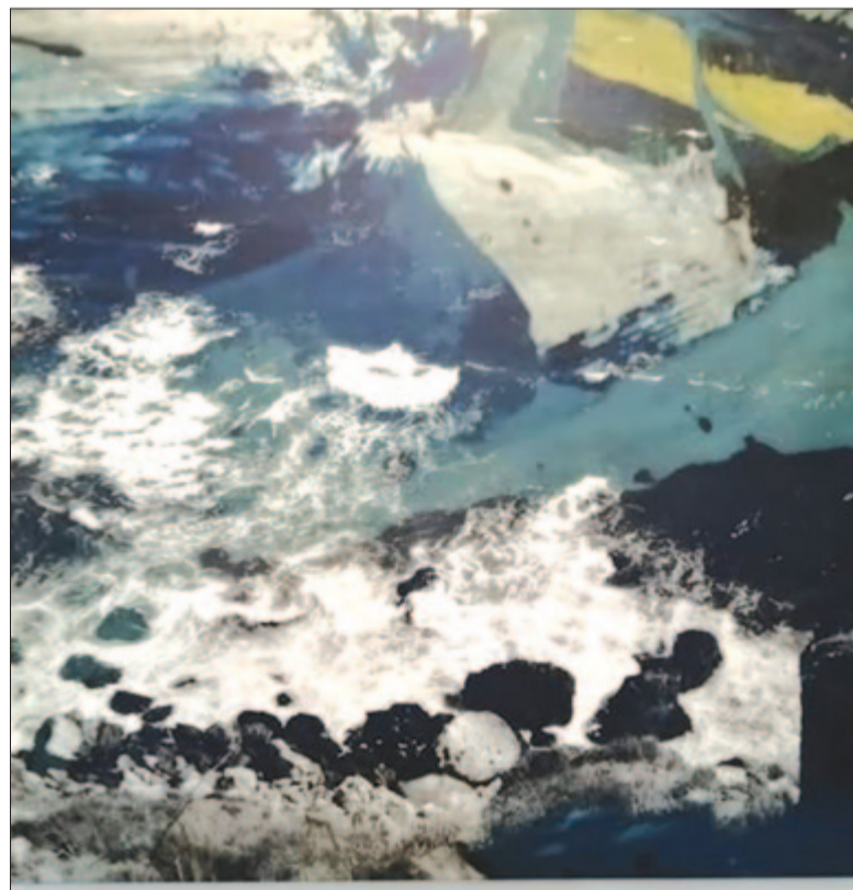
Az óceán egyik arca – Radu Florea festménye