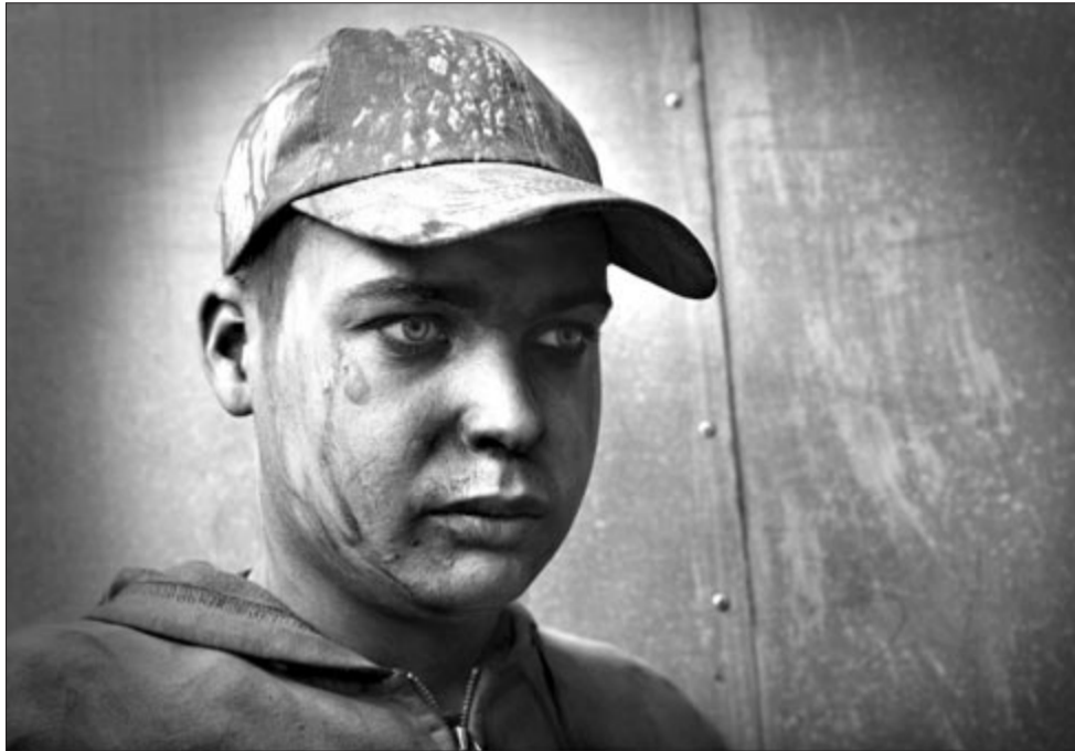
A mesterség továbbvivője

tosnak tűnő folyamatba. Tavasztól őszig autózva, többnyire távolról felsejlik valahol a tájban a szénégetők karámja, a kúp alakú, füstölő boksa, közeledve meg is üt a faszén létrehozásának jellegzetes szaga, de ennél többről nemigen értesülünk. Ez a kiállítás árnyaltan, érzékletesen nyújt ismereteket és némi tapasztalatot a szénégetőkről, helytállásokról, a sok-sok nehézségről, amelyekkel munkájukban, életformájukban meg kell kü-